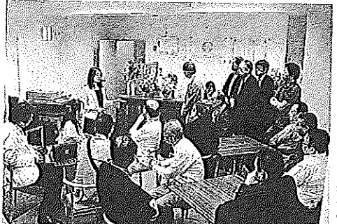
東京駅近くに10日開設した「東京アントレサロン」。見学会に多数が集まった